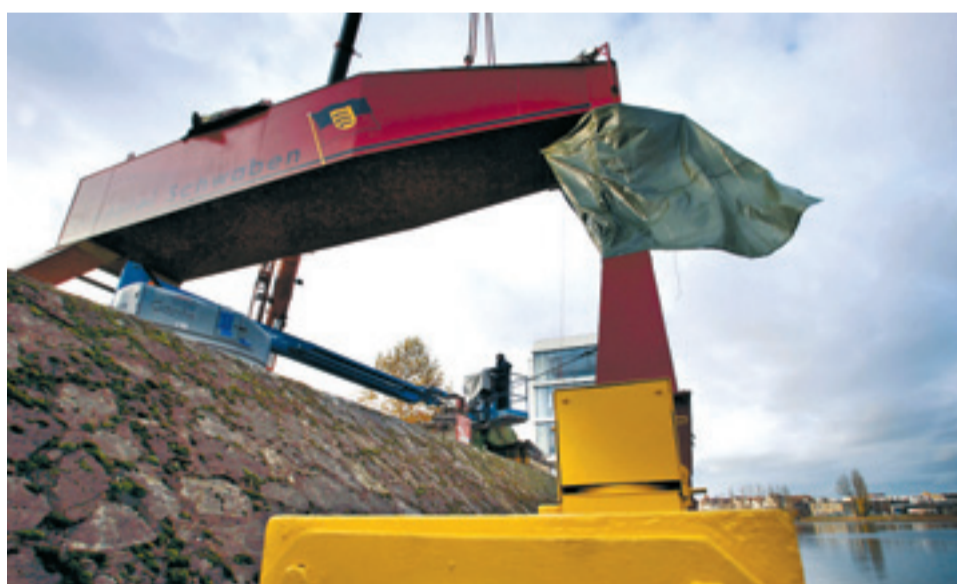
Der neue Kran am Westkai ist zwar gebraucht, aber gut in Schuss.

Für die Gewerkschaft hat die AWS in den vergangenen Jahren einen „vorbildlichen Optimierungsprozess begonnen, der von uns auch weiterhin mitgetragen wird“. Seit 2003 seien allein bei der Müllabfuhr 60 Stellen abgebaut worden. Im gleichen Zeitraum habe man den Fuhrpark um 21 Müllfahrzeuge verkleinert. „Das ist eine Einsparung von 3,5 Millionen Euro“, betonte Rudi Widmaier, Verdi-Vertrauensmann bei dem städtischen Entsorgungsbetrieb. Bis 2007 setze man zudem alle von den Gutachtern geforderten Verbesserungen um. Falls die Privatisierungspläne nicht aufgegeben werden, will Verdi diese per Bürgerentscheid stoppen. „Der ist auch bei einer Teilprivatisierung möglich“, so Vorderwülbecke. Es komme nur auf die richtige Formulierung an.